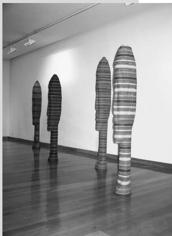
Aspecto de la exposición en Lumbreras y de algunas obras.