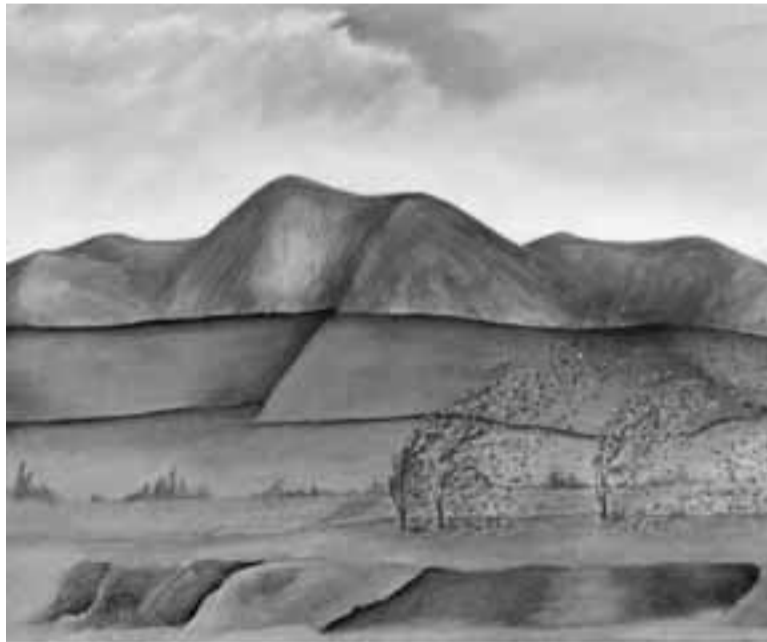
Uno de los paisajes de Valverde expuestos en Alga.

La exposición de Valverde guarda sorpresas porque brinda la ocasión de ver varios cuadros que nada tienen que ver con la tónica habitual de su trabajos. El visitante puede ver varias obras en las que diversos